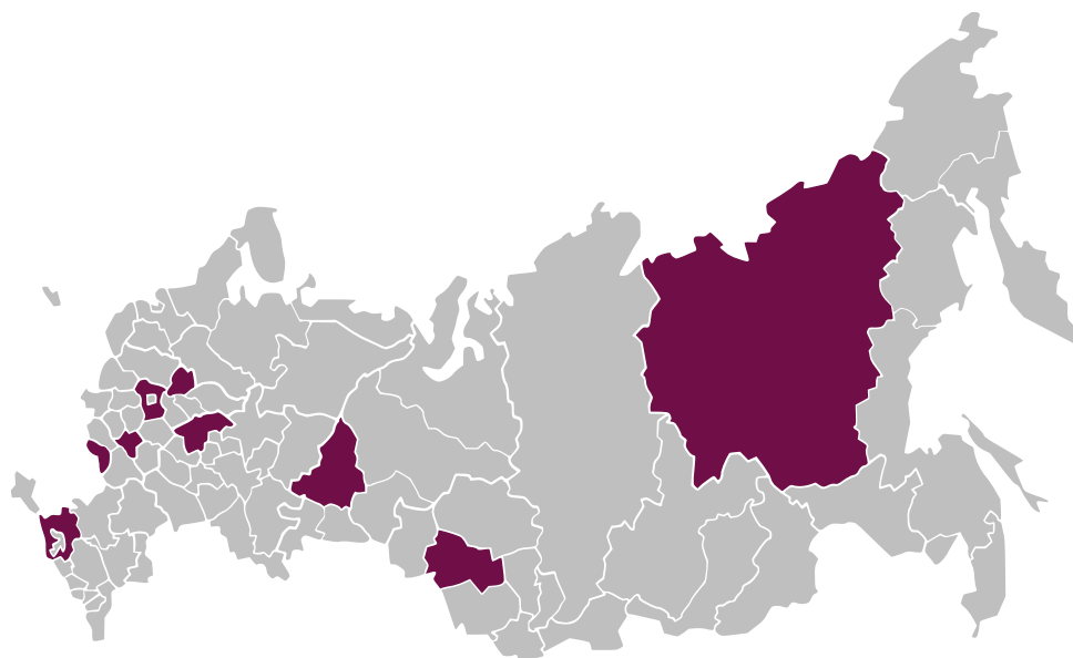
Рисунок 2. В 2019 году лишь девять регионов разместили новые выпуски облигаций

За 11 месяцев 2019 года совокупная номинальная стоимость размещенных облигаций российских регионов и муниципалитетов изменилась незначительно по сравнению с началом года (+16,42 млрд руб.). На 01.12.2019 объем непогашенных облигаций российских регионов составил 565,45 млрд руб. (30% их общего долга), муниципальных образований — 20,46 млрд руб. (6% их долга).