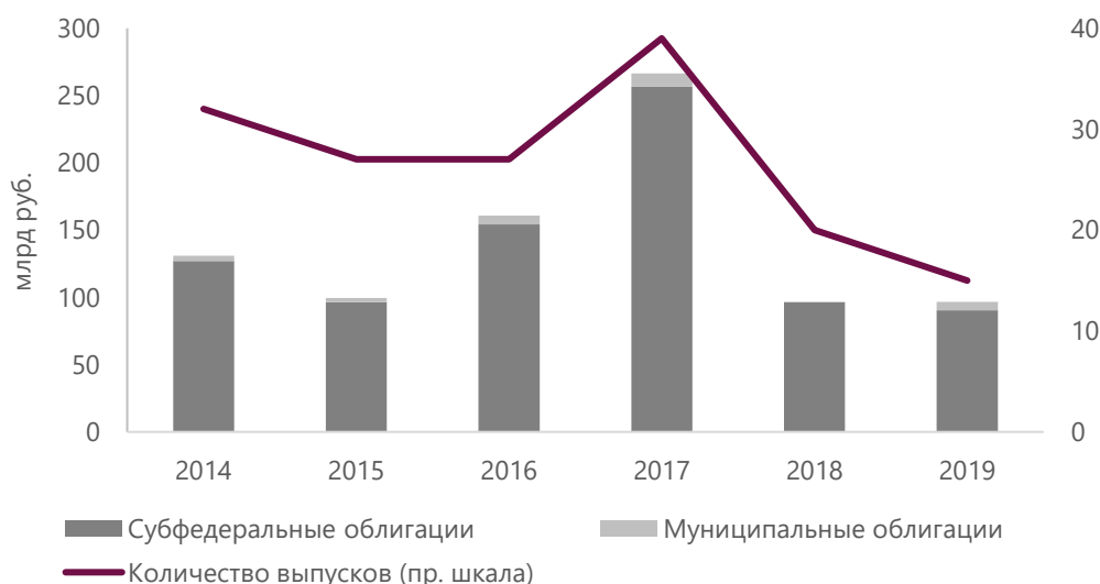
Рисунок 1. За последние шесть лет пиковый объем размещений наблюдался в 2017 году

В 2019 году 80% размещаемых облигаций имели кредитный рейтинг АКРА, в 2018-м — 72%.