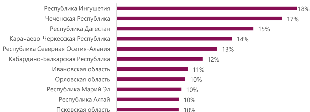
Рисунок 1. Субъекты РФ, которые могут потерять более 10% собственных доходов консолидированного бюджета

На сегодняшний день порядок возмещения выпадающих доходов регионов и муниципалитетов неясен. Очевидно, что более всего от снижения размера поступлений по НДФЛ потеряют субъекты, в которых существенная доля работников имеют низкий уровень оплаты труда. По данным Росстата за апрель 2019 года, в 26 субъектах РФ более 40% граждан имели заработную плату не более двух МРОТ. В Республике Калмыкия и регионах Северо-Кавказского федерального округа (за исключением Ставропольского края) доля таких граждан превышает 50% работающего населения. Для некоторых бюджетов снижение поступлений по НДФЛ может быть критичным (рис. 1).